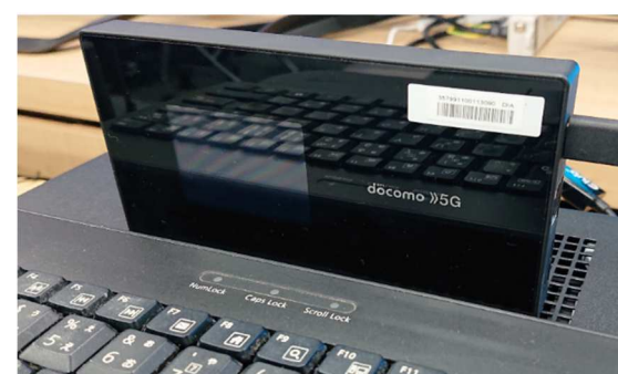
5G送受信機(据付型、ポータブル型) (5G→5Gで8K映像をダウンリンク)