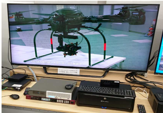
被災現場／想定(8Kドローン撮影)