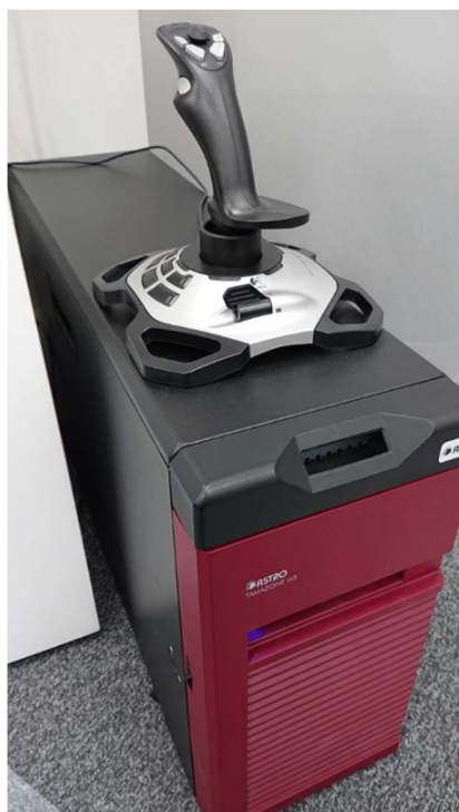
8K映像切り出し装置