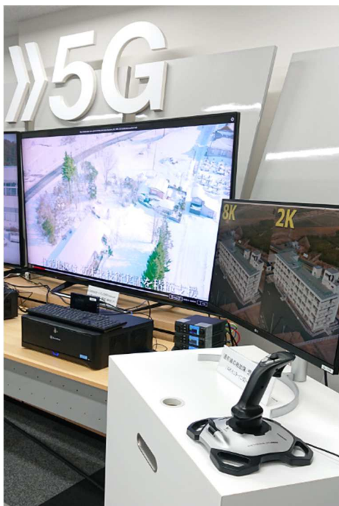
前線の救助隊/想定 (広域8K映像より救助ポイント映像を随時拡大表示)