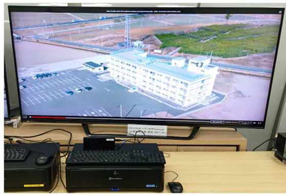
災害対策本部／想定(被災地8K映像上映)