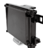
ミリ波レーダー（電子スキャン方式）